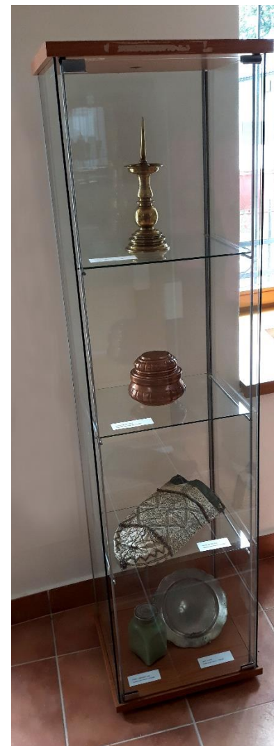
História Popradu – Veľkej a jej okolia