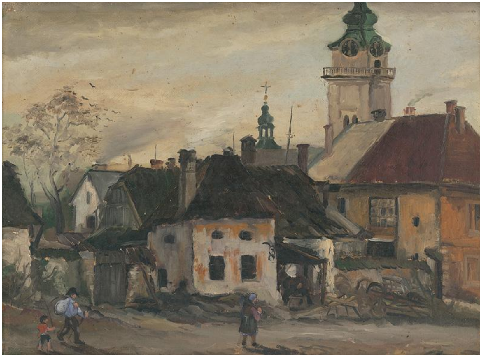
Stará Veľká – Ondrej Ivan, 1956, olej, 60x45 cm